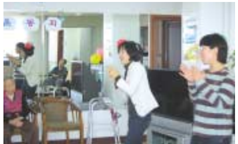
놀이치유를 진행하고 있는 봉사자들