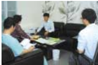
현장 확인 대화