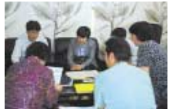
평가 기록 확인 및 서명

본 시설에서도 시설평가를 통해 지금까지 시설 중심으로 운영하던 방식에서 어르신(수급자) 중심으로의 변화를 가져오는 기회가 되었으며, 이는 곧 수급자들의 이용성, 편리성, 자율성, 독립성 등을 보장하는 계기가 된 것으로 볼 수 있습니다.