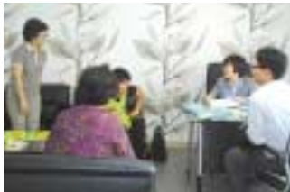
서류 담당자 확인

한나요양원은 지난 9월 29일, 한나그린힐은 10월 27일에 평가를 받았으며, 이를 통해 많은 변화와 새로운 도전의식을 느끼게 되는 기회가 되었습니다.