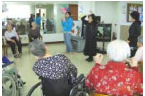
구연동화를 듣는 어르신들

이 프로그램들은 건강하신 어르신뿐만이 아니라 요양인정 등급 1, 2등급 받으신 분들도 모두가 참여하실 수 있고 어르신들과 젊은 봉사자들 간에 아무 거리낌이 없이 40~50분정도 진행을 합니다. 비록 한 두 번씩 진행을 하였지만 봉사자들의 열의와 어르신들에 대한 사랑이 많아서 이들 프로그램은 어르신들이 좋아하는 프로그램이 되지 않을까 기대해 봅니다.